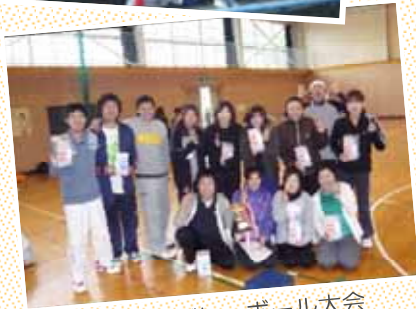
院内バレーボール大会