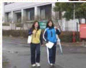
新人研修の歩行ラリー