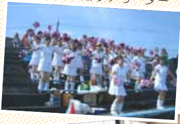
労組応援部チアリーダー