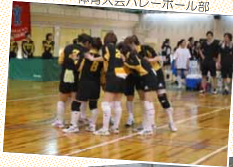
体育大会バレーボール部