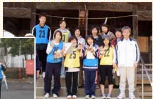
新人研修の歩行ラリー